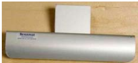
Sett forfra. POSEHENGER UNDER

For feste på Vegg og UNDER bordplate. Natureloksert aluminium eller Lakkert Stål.