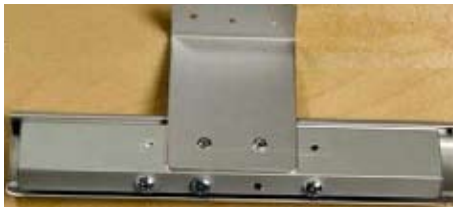
Sett bakfra med Skruer i Vinkelen for å Skru UNDER BORDPLATA.